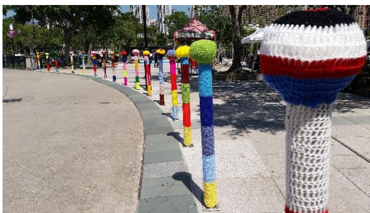
藝術家：Esther Poon (沙田公園)