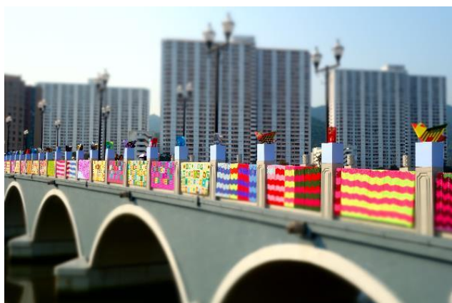
藝術家：Esther Poon 及何紫君 (沙田公園)