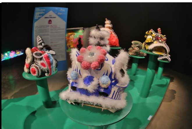
委約藝術家陳詩歷/ 歐陽秉志師傅 與 大師班學生作品 (ARTISTREE)