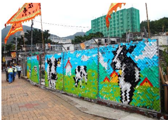
藝術家：Graphic Airlines (薄扶林村)