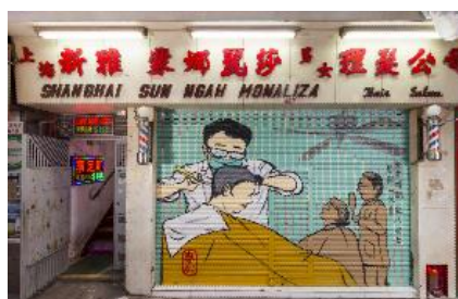
上海新雅蒙娜麗莎男女理髮公司 地 址：新填地街 457 號地下 類 型：理髮店 藝術家：麥嘉欣