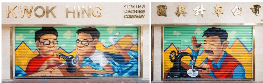
國興針車公司 地 址：荔枝角道 103-107 號 類 型：衣車零件設計及生產 藝術家：Smile Maker