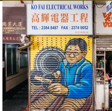
高輝電器工程 地 址：廣東道 900-904 地下 類 型：摩打修理 藝術家：姜立如