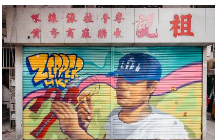
祖記 地 址：黃竹街 1 號 F 地下 類 型：製衣配件零售 藝術家：Smile Maker