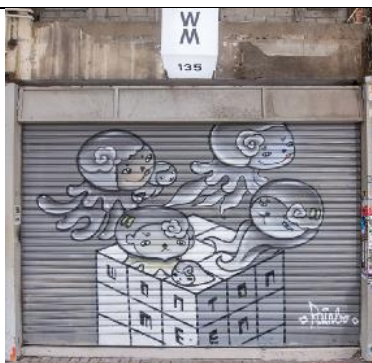
Wontonmeen 地 址：荔枝角道 135 號 類 型：青年旅舍 藝術家：彭怡