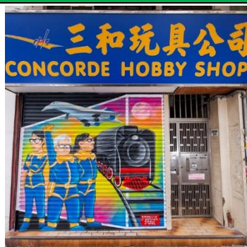
三和玩具公司 地 址：荔枝角道 331 號 類 型：玩具零售 藝術家：麥嘉欣