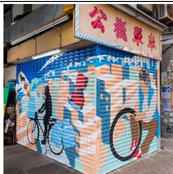
公棧單車 地 址：基隆街 98 號 E 類 型：單車零售及維修 藝術家：黃志豪