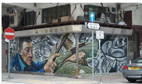
勤記不銹鋼工程 地 址：新填地街 225 號 類 型：不銹鋼工程 藝術家：Uncle