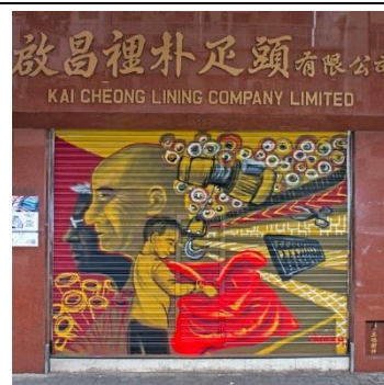
啟昌裡朴疋頭有限公司 地 址：汝州街 73 號地下 類 型：布料貿易 藝術家：麥嘉欣