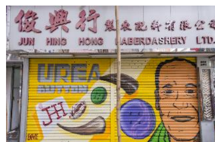
俊興行製衣配料有限公司 地 址：南昌街 110 號 C 地下 類 型：製衣配件批發及零售 藝術家：Devil