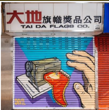
大地旗幟獎品公司 地 址：上海街 406 號地下 類 型：旗幟獎品 藝術家：Devil