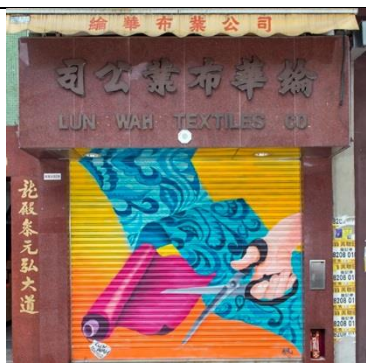
綸華布業公司 地 址：基隆街 92 號 類 型：布料貿易 藝術家：黃詠楓