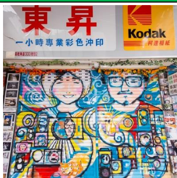
東昇專業沖印 地 址：荔枝角道 333 號 B2 類 型：相片沖晒、二手攝影器材 藝術家：海潮、五位寧波公學的學生