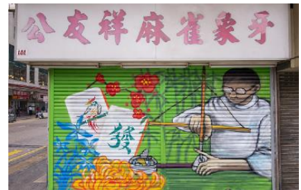
公友祥麻雀 地 址：上海街 661 號 C 地下 類 型：麻雀零售 藝術家：姜立如