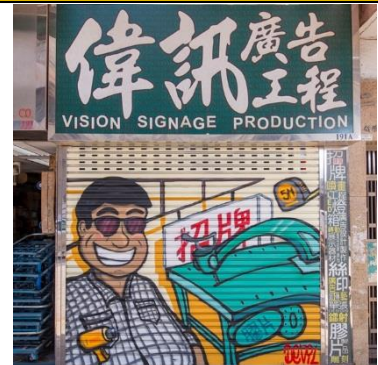
偉訊廣告工程 地 址：新填地街 191A 號地下 類 型：廣告工程 藝術家：Devil